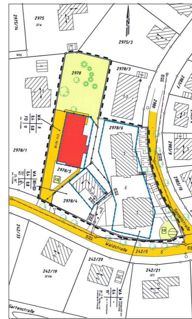
2. Änderung Vorhabenbezogener Bebauungsplan von 2011